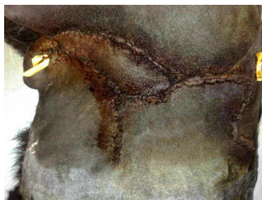
Depois da operação