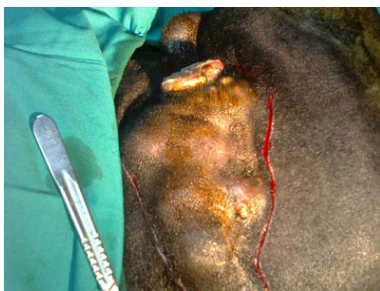
Antes da operação

Os primeiros exames revelaram Leishmaniose e subnutrição, estando muito fraco e anémico. Fez o tratamento inicial e começou a recuperar peso e o pêlo voltou a crescer, mas quis o destino que o nosso menino voltasse a decair, desta vez com o surgimento de vários tumores malignos que lhe foram retirados. O Tigrão vai agora iniciar a quimioterapia, pois apesar de ter Leishmaniose, essa é a sua maior probabilidade de sobrevivência.