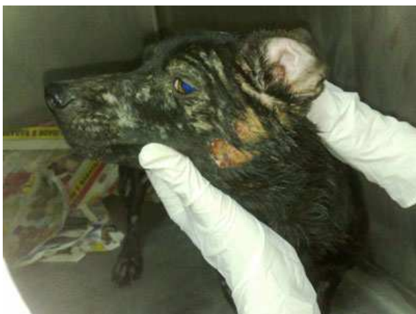
Fase 1 – Quando foi encontrado.