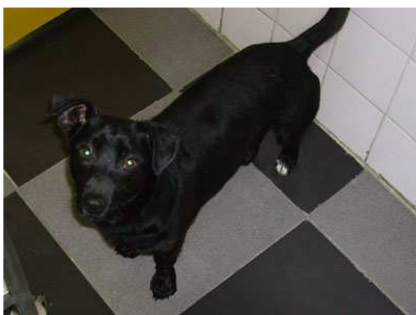
Fase 3 – Lindo, lindo!

O Piu foi encontrado a deambular nas ruas da Abóboda-Parede no estado mostrado na primeira foto. Débil e muito doente, com feridas abertas e sem pêlo. Enxotado pela maioria das pessoas que se sentem incomodadas pela visão de um cão doente, o pobrezito foi sobrevivendo como pôde, até encontrar uma amiga dos animais que não ficou indiferente à sua dor. E foi assim que o Piu entrou na APCA.